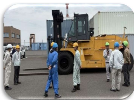
職場見学_運搬・物流業