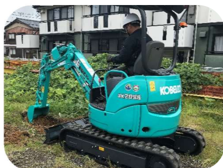
小型建設機械_ユンボ操作