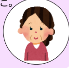
60代女性 小津外科医院 就職 (R6年度 修了生)

この3か月とても有意義な時間を過ごせたと感じています。今後も自宅でパソコンの勉強を続けていこうと思っています。真剣に授業を受けることができ、とても楽しく、学生に戻ったような気分でした。