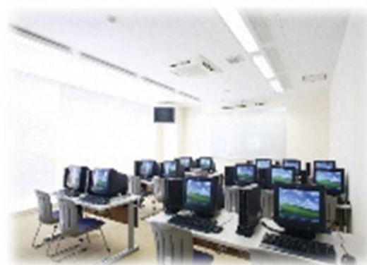
訓練教室イメージ