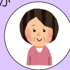
50代女性 自営業 (R6年度 修了生)

年齢や出身地も違えば、職歴も違うという中で学べたことはとても貴重な経験でした。先生の授業はとても分かりやすく、丁寧にかつ、的確に指導してくださりました。お蔭で、 パソコンが嫌いだった私でもパソコンが楽しい と思えるようになりました。介護の授業では、介護職の大変さを改めて知ることができたと同時に、これからの介護職従事者不足について危機感を感じました。3ヶ月間の訓練、本当にありがとうございました。