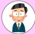
60代男性 (株)クリハラント 就職 (R6年度 修了生)

高年齢の私が、「覚えてもすぐ忘れる」を繰り返す中、諦めることなく最後まで丁寧に指導いただきありがとうございました。 残りの人生、最後の就職になろうかと思いますが、学ばせていただいたことを色々と思い出しながら与えられた仕事に活かしたいと思っています。