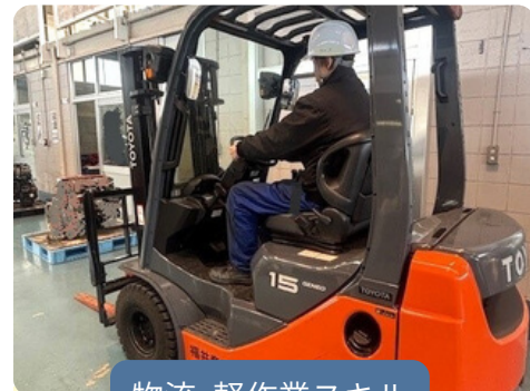
物流・軽作業スキル